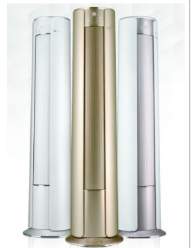
i 慕·MUSES i 尚·SHINE

润典、润享作为与 i 慕、i 尚相对应的空调挂机，是安置于卧室的极佳选择，超舒适的体验助你安然入睡。润典、润享搭载格力原创的 1Hz 超低频变频控制技术，使空调低频运行时不停机，免除空调反复启停造成的电能损耗，同时也营造恒温舒适的温度场。润典、润享还采用格力原创的导风板运动分流技术，使得送风更远更宽广。此外，润典、润享还能够左右自动大宽幅送风，让房间每